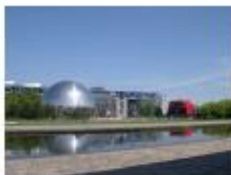
Géodesique i Parc de la Villette lige ved Leplaf