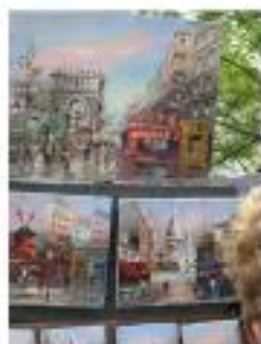
Malerier ved Sacre Coeur Sacre Coeur →